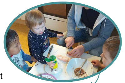
Smullen van Groenlands eten