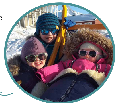
Lente in Tasiilaq