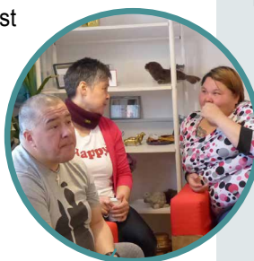
Na de dienst